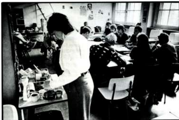
Stamgroep B in actie: verwijten en verdiediging vliegen over tafel.

Na een experimentele periode is het systeem zes jaar geleden ingevoerd. "En sindsdien gaan groeien", vertelt docent Rob Woortman. "De twijfelaars van toen doen nu ook aan het stamgroepsysteem mee en dat bewijst een beetje het succes".